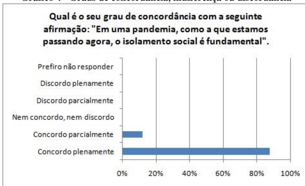
Gráfico 4 - Graus de concordância, indiferença ou discordância

Por fim, buscando garantir a confirmação dos dados anteriormente levantados, os jovens sujeitos foram apresentados a uma afirmação e deveriam, de acordo com a escala Likert (1932), manifestar seu grau de concordância (plena ou parcial), indiferença ou discordância (plena ou parcial). A afirmação era “em uma pandemia como a que estamos passando agora, o isolamento social é fundamental” e os dados podem ser observados no gráfico 4.