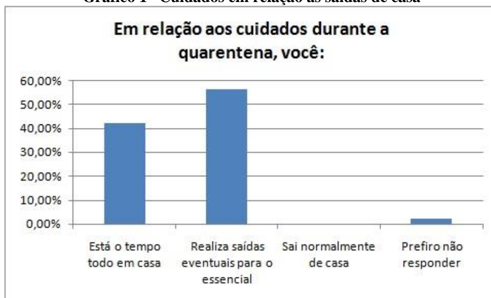
Gráfico 1 - Cuidados em relação às saídas de casa

A relação dos jovens com a cidade em meio à pandemia da COVID-19 pode ser lida e interpretada, como já anunciado, a partir de múltiplas lentes. Entende-se, portanto, que uma primeira análise deve ser feita a partir da relação de fluxo urbano desses jovens durante a vivência da quarentena. Para isso, questionamos os sujeitos com a seguinte pergunta: “em relação aos cuidados durante a quarentena, você:” e os jovens tinham três opções fechadas de respostas: a) está o tempo todo em casa; b) realiza saídas eventuais para o essencial; c) sai normalmente de casa. Ainda, visando à garantia ética do estudo, a opção “prefiro não responder” também estava disponível.