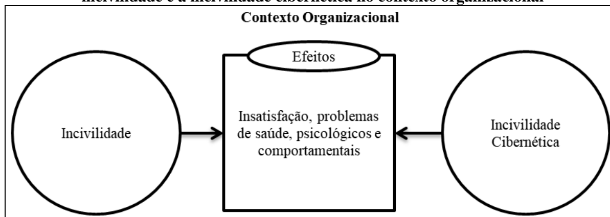
Figura 2 – Modelo conceitual dos efeitos da incivildade e a incivildade cibernética no contexto organizacional

Fonte: Elaboração própria. Adaptada de Pearson, Andersson e Porath, (2000); Cortina e Magley (2009); Lim e Teo (2009); Giumetti et al. (2013); Zhou et al. (2015).